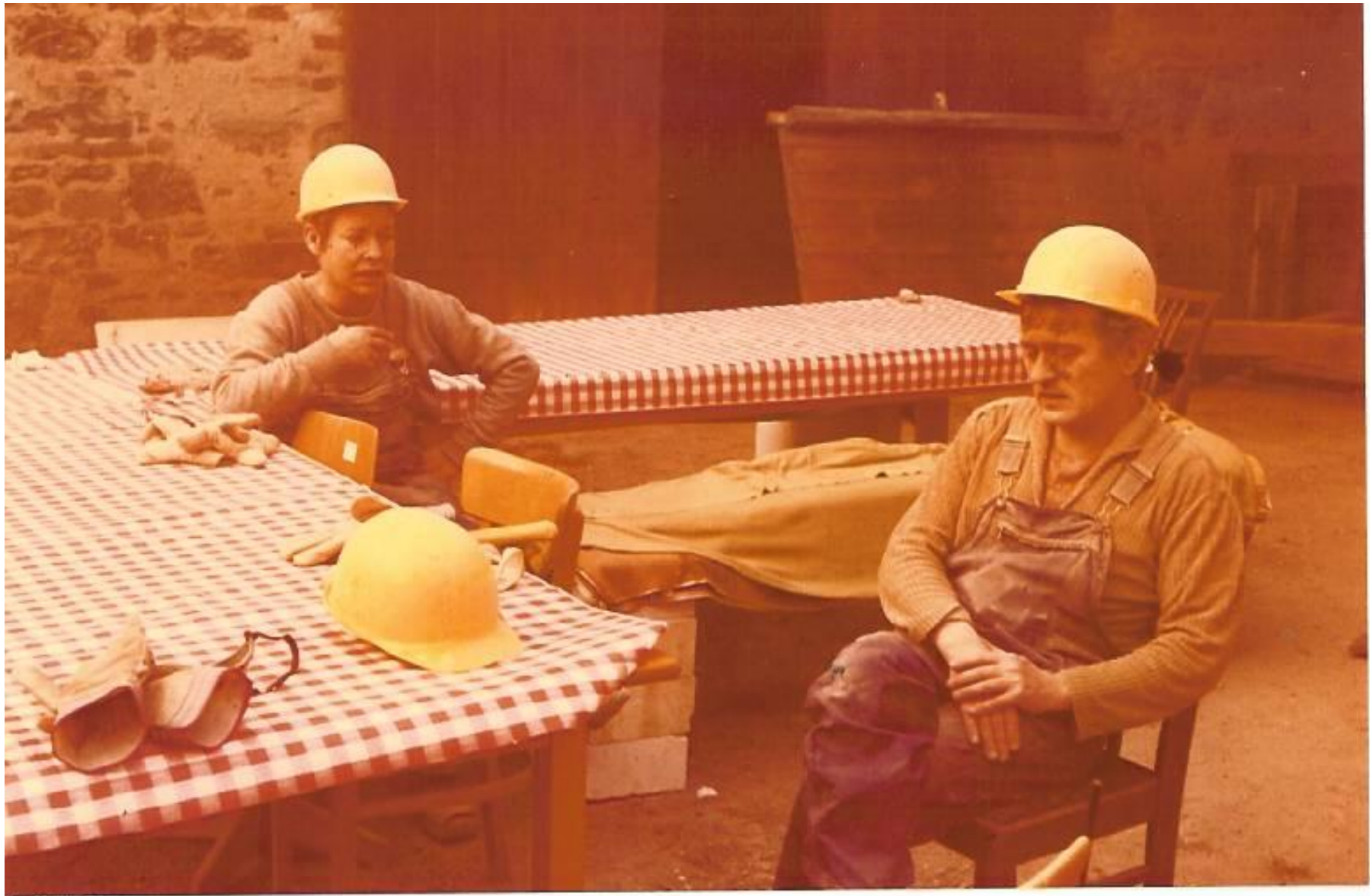
Die Frau des Architekten und ihr Ehemann sind auch erschöpft und legen verdient eine Pause ein.